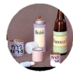
สารระเหย

4. ยาเสพติดประเภทออกฤทธิ์ผสมผสาน กล่าวคือ ในช่วงแรกออกฤทธิ์กระตุ้นประสาท เมื่อเสพมากขึ้นจะ ออกฤทธิ์กดประสาท และทำให้ประสาทหลอน ซึ่งได้แก่ กัญชา